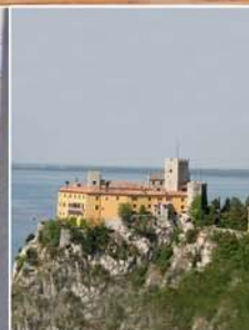
10. Oktober 2009 San Michele del Carso (I) Gostilna Devetak