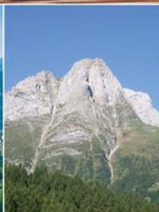
27. Juni 2009 Plöckenpass Elfi Salcher