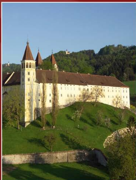
Stift St. Paul

Machen Sie sich auf die Spurensuche der Romanik in Kärnten und bestellen Sie kostenlos Ihren persönlichen Kulturwanderführer „TRANSROMANICA“