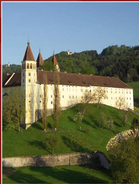
Stift St. Paul

Machen Sie sich auf die Spurensuche der Romanik in Kärnten und bestellen Sie kostenlos Ihren persönlichen Kulturwanderführer „TRANSROMANICA“