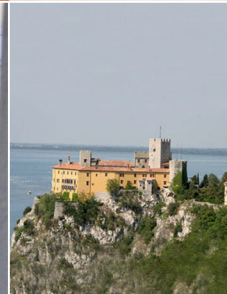
10. Oktober 2009 San Michele del Carso (I) Gostilna Devetak