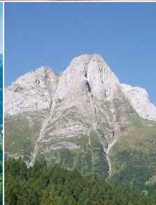
27. Juni 2009 Plöckenpass Elfi Salcher